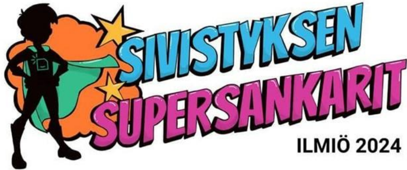
Kuva: Ilmiöprojekti 2024 (Camilla Patjas)

Ilmiötyöskentely tapahtuu kevätlukukaudella ja sitä koordinoi opettajien ilmiötiimi, jonka vetäjä on opettaja Essi Palojärvi.